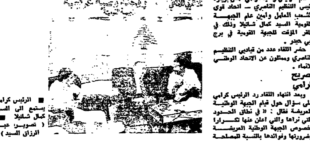
الرئيس كرامي يتوسط الى السيد كمال شائلا

قام الرئيس رشيد كرامي امس بزيارة رئيس التنظيم القومي - اتحاد قوى الشعب المائل وامين عام الجبهة القومية السيد كمال شائلا وذلك في المقر المؤقت للجبهة القومية في برج ابي حيدر. حضر اللقاء عدد من قياديي التنظيم القومي، ويمثلون عن الاتحاد الوطني للشباب كرامي. وبعد انتهاء اللقاء، رد الرئيس كرامي على سؤال حول قيام الجبهة الوطنية العربية فقال: «في نطاق الحدود التي اراها والتي اعلن عنها تكرارا بخصوص الجبهة الوطنية العربية وضرورتها ونواحيها بالنسبة للصحة السياسية العامة، ذلك ان كل توحيد للجهد وجمع للصوت هو من اجل خدمة الاهداف الواحدة واجتاد صيغة الوقت السياسي على مبادئ الإصلاح تتفق لبنان الجديد الذي يطرح اليه ابناؤ.» من كل هذا نعلم ونحاول وننتقل مع التقوى التي لها دورها في الساحة اللبنانية وعلى هذا نرجو ان يكون اجتماعنا اليوم مع الجبهة القومية مجالا للبحث في كل ما يقربنا من غاياتنا ويحقق ما نيه الخير والتقدم نظرا لان المرحلة الحاضرة هي تفاق وخضرة تتطلب من الجميع القيام بما يفرضه عليهم واجههم ومسؤوليتهم. واضاف الرئيس كرامي: «الواقع ان الوضع في حالة جمود وركود وان الخطوات التي كانت متوقعة لا تزال خجولة ووبيدة وهذا مما يزيد في تعاملا بضرورة قيام الجبهة الوطنية العربية لانها قد تنفع بالموقف الى ما فيه الاستمرار والانطلاق في عملية الاعمال منها.»